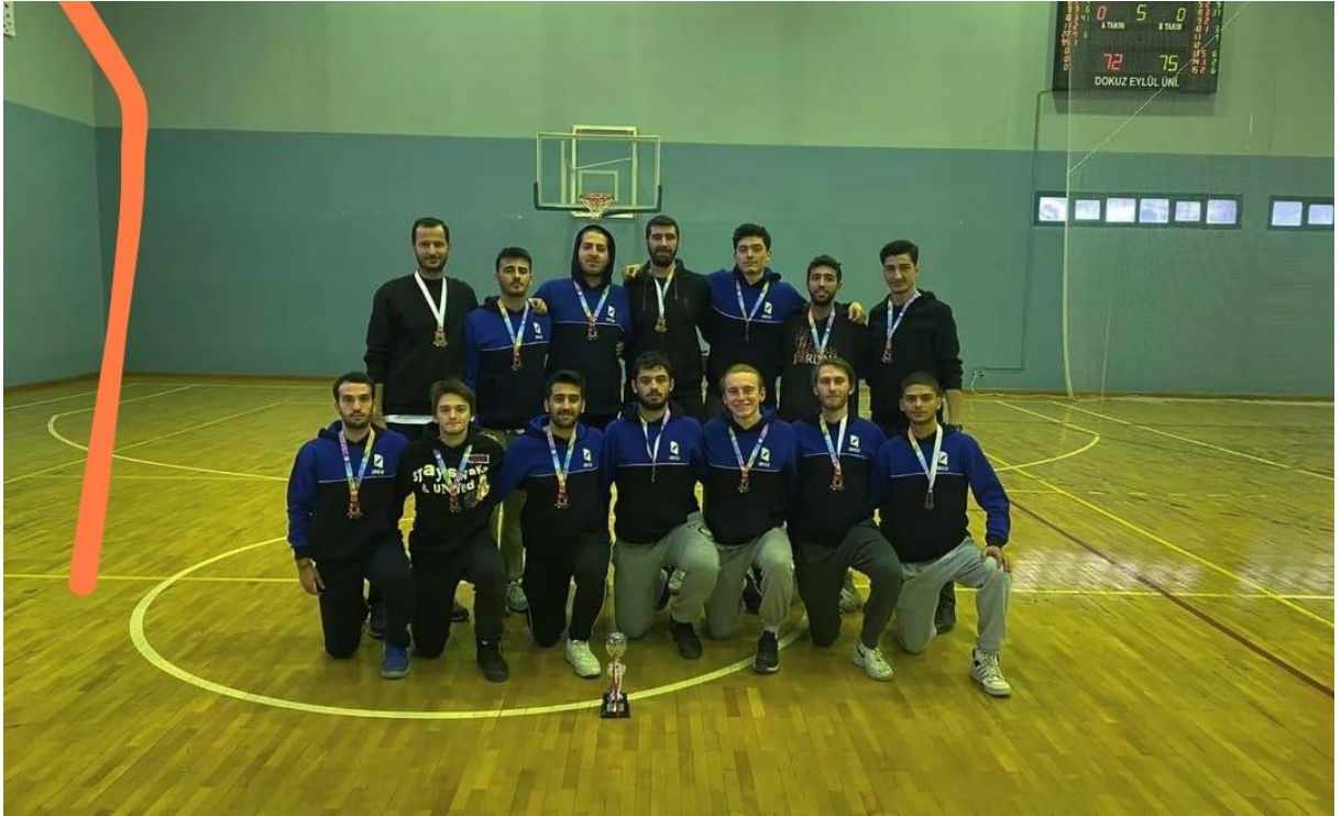
Görsel-2: Erkek Basketbol Takımımız 3.lük Kupası ile